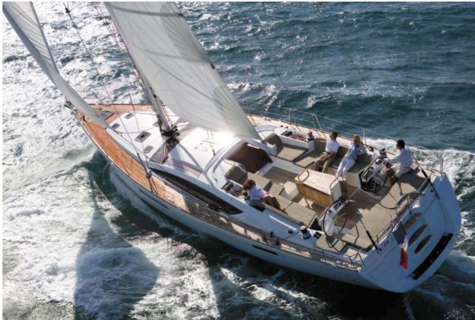
Unser Segelschiff – die Jeanneau 57

„Ein positiv realistisches Selbstbild gewinnen – Leadership-Training auf Segelyacht“